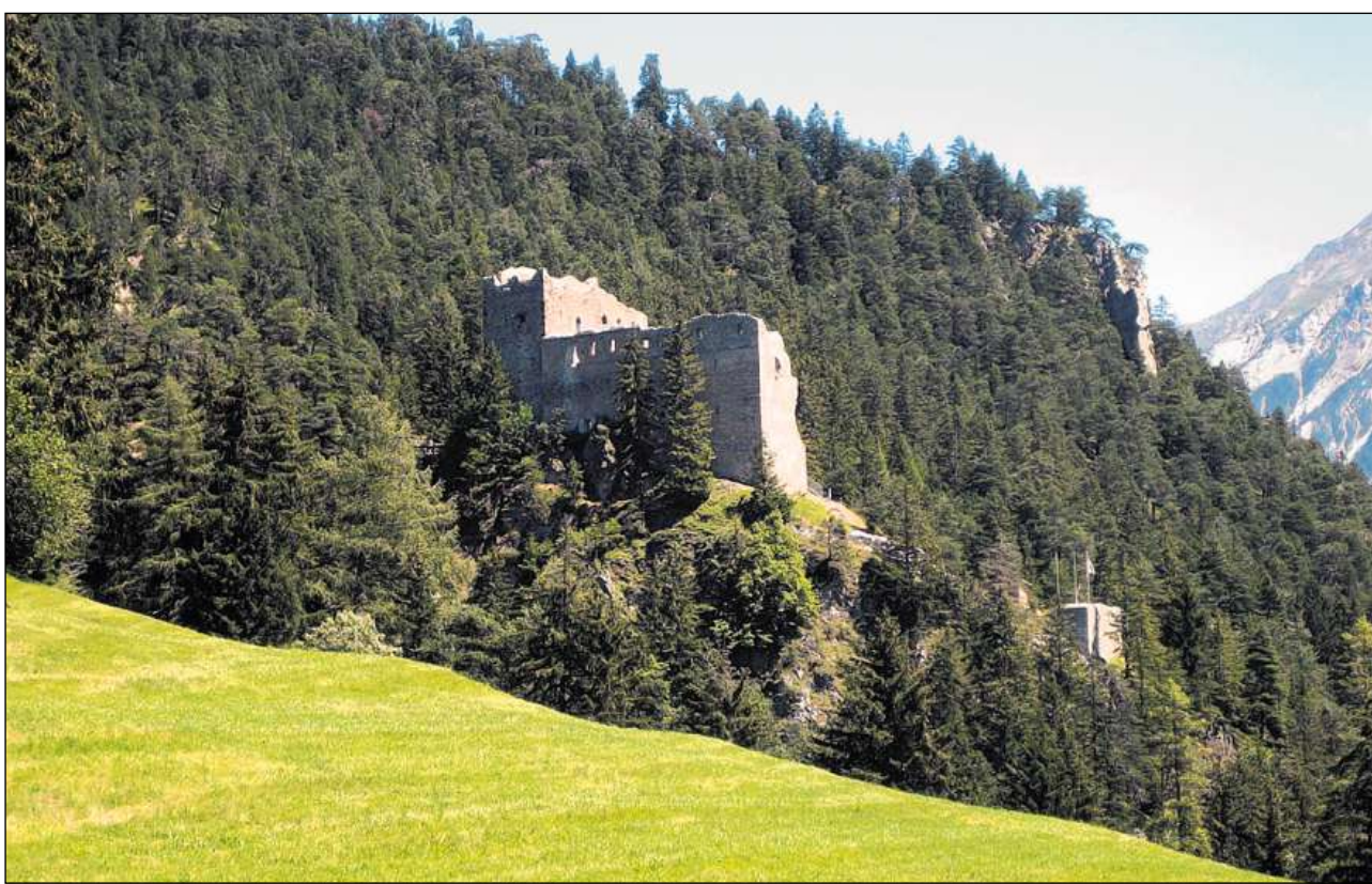
L'imposanta ruina da Belfort, situada a l'ost da Brinzauls.

In chastè cumpiglia essenzialmain las suandantas parts: il mir da tschinta enturn il singul edifizis che po esser circumdà d'in foss cun u senza aua. Intgins dals complexs fortifitgads han in chastè avanzà che dispona medemmain d'in mir da tschinta. La tur principala (tur grossa) è la part la pli marcanta e savens era la pli veglia da l'entir complex ed ha qua tras ina posiziun dominante; ina stgala lunga maina a la tur grossa; en la plipart dals chastels dal Grischun era quella abitada ed aveva perquai almain in local cun chamin per