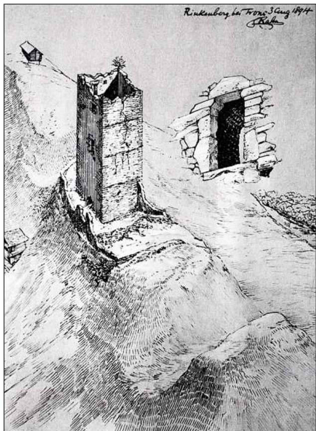
En il 19avel tschientaner è renaschi l'interess per l'istorgia dals chastels.

Il LIR cumpiglia bundant 3100 artitgels (geografics, tematics, artitgels da famiglias e biografias) davart l'istorgia grischuna/retica e la Rumantschia. Editura: Fundaziun Lexicon Istoric Svizzer; versiun online: www.e-lir.ch; versiun stampada: www.casanova.ch u en mintga libreria.